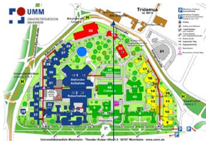
Veranstaltungsort Alte Brauerei

Buchen Sie Ihre Reise online unter „ www.aey-congresse.de “ und halten Sie Ihre Kreditkarte zur Zahlung bereit.